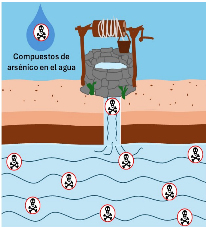
Figura 1. Agua subterránea contaminada con una sustancia invisible: el arsénico.

El arsénico es uno de los compuestos químicos de mayor preocupación en el mundo, según la Organización Mundial de la Salud (OMS) (World Health Organization, 2019). Aun cuando el arsénico se encuentra en los seres vivos en muy bajas concentraciones, bajo ciertas condiciones es muy tóxico y produce diferentes enfermedades. El arsénico se ha asociado con el cáncer de vejiga, pulmón, piel, riñón, fosas nasales, hígado y próstata. También se conocen daños no cancerígenos, entre los cuales se encuentran: engrosamiento y decoloración de la piel, malestares estomacales, náuseas, vómito, diarrea, entumecimiento de pies y manos, parálisis parcial y ceguera (Environmental Protection Agency, 2001).